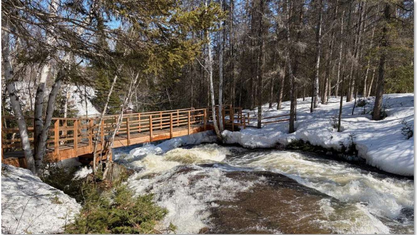
Les sentiers du Lac Rouyn, printemps 2026