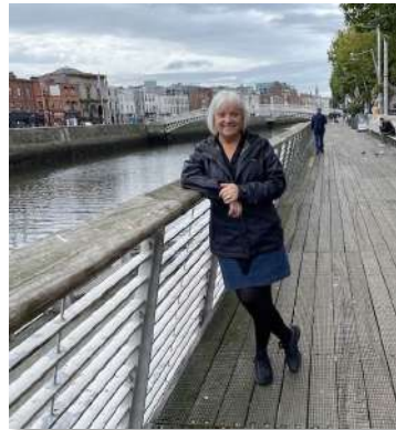
Au bord du fleuve Liffey (Irlande)