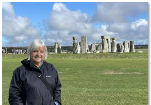
Le site de Stonehenge (Angleterre)